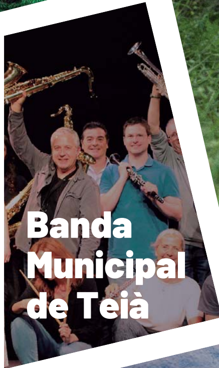
Banda Municipal de Teià