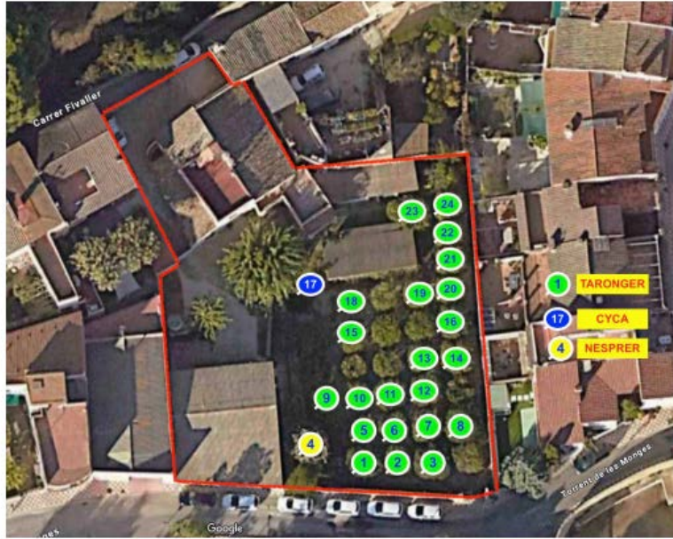
Fotografia aèria 2. Identificació i ubicació dels peus arboris avaluats en el treball de camp

En el treball de camp s'ha pogut comprovar que els arbres n° 5, 6, 9, 10, 11, 12, 13, i 15, 18 i 19 tenen, de manera generalitzada i en diversos graus, un aspecte feble i decaïgut, creixement vegetatiu inferior a l'esperat per a l'espècie i l'edat de l'arbre, pèrdua anormal de fulles, clorosi fèrrica generalitzada, presència de taques marrons a les fulles (possiblement causades per la malaltia "antracnosi" Colletotrichum gloesporioides ), mosca blanca; i en alguns peus chancro i restes de marques de Phytophthora (ara sense manifestació per la sequera existent). Aquests símptomes, són compatibles amb el CTV en exemplars madurs de tarongers. En aquests peus abans anomenats son uns possibles portadors d'enfermetat a lloc final en cas de transplantament. Per tant, en aquests casos es desaconsella el transplantament donades les reduïdes possibilitats de sobre vivència dels peus arboris i/o la possibilitat d'infestacions a d'altres exemplars en el lloc de destinació final al no ser exemplars sans en origen i també seguint les directrius del Ministerio de Agricultura com es pot veure a continuació.