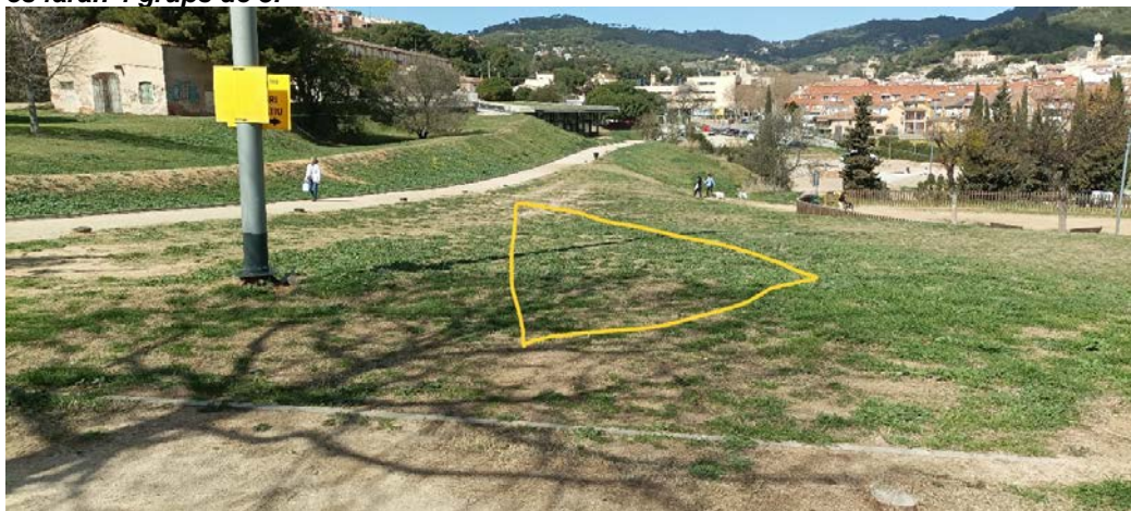
Imatge del primer grup