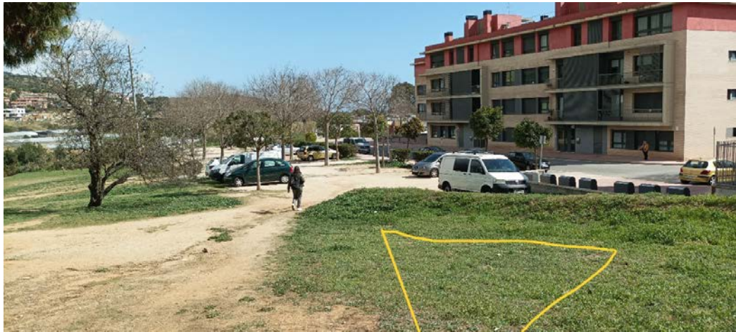
Imatge del tercer grup.

El quart grup serà pròxim dels 3 anterior.