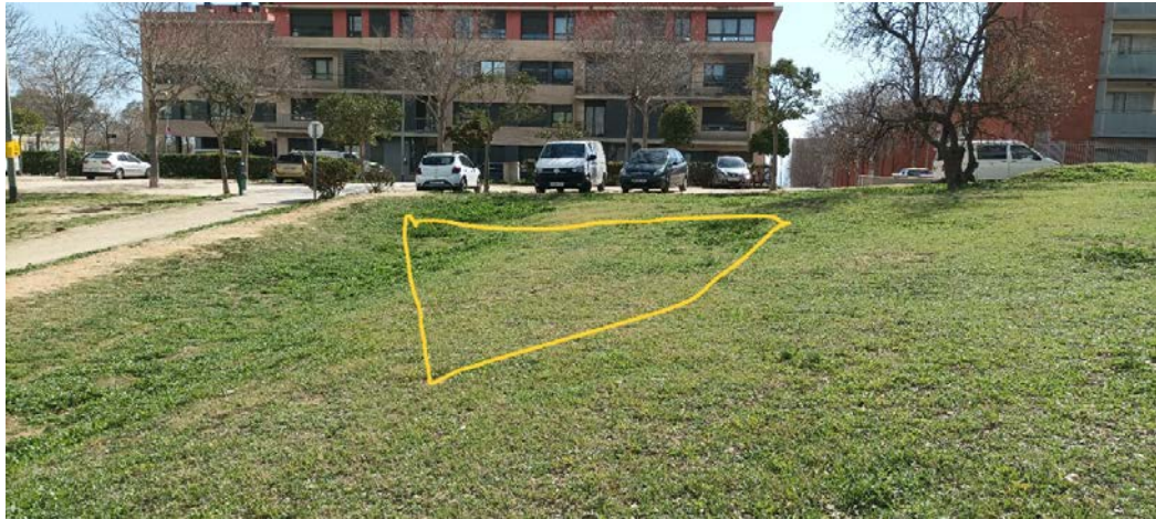
Imatge del segon grup.